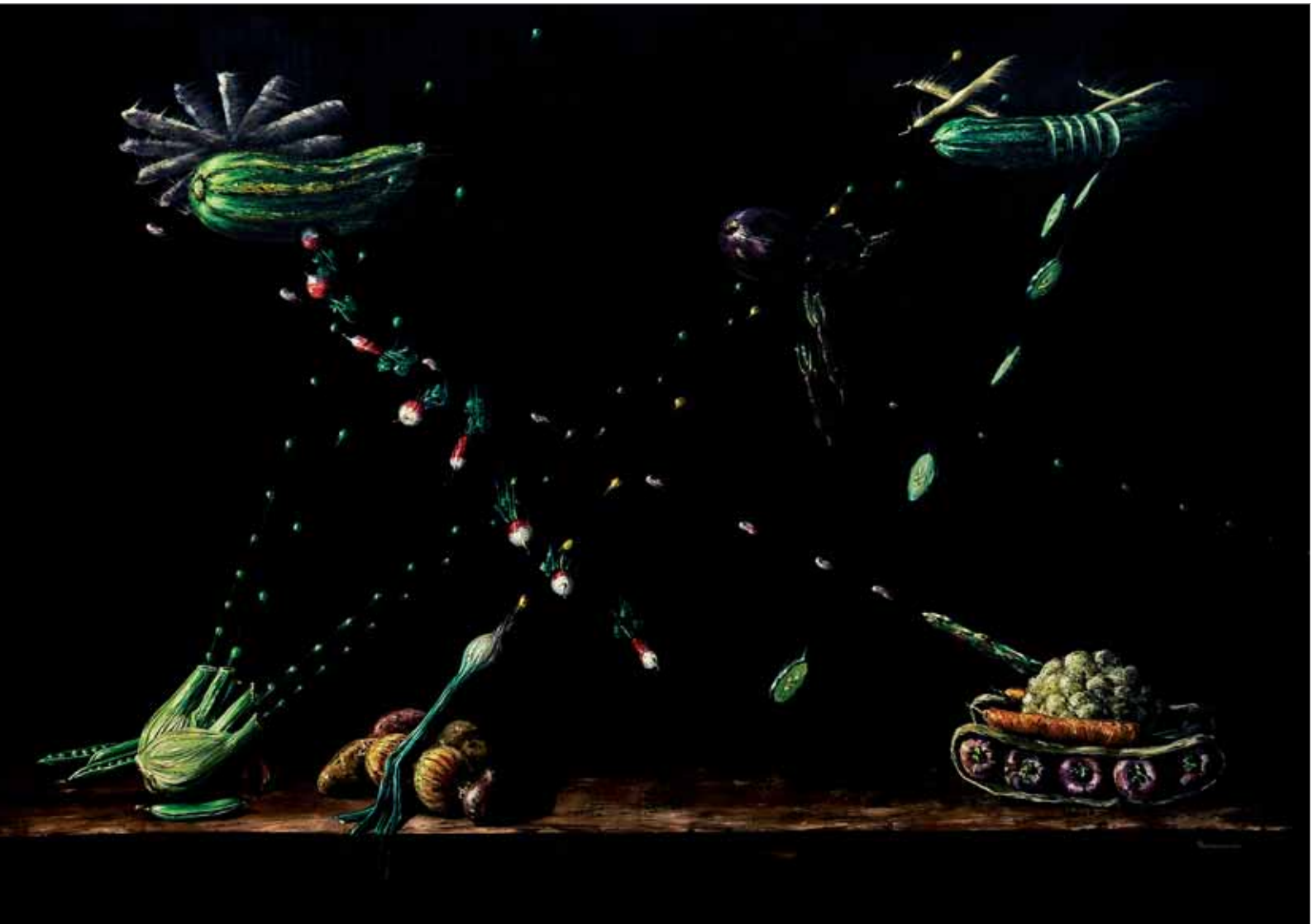
Opération macédoine 116 x 81 cm