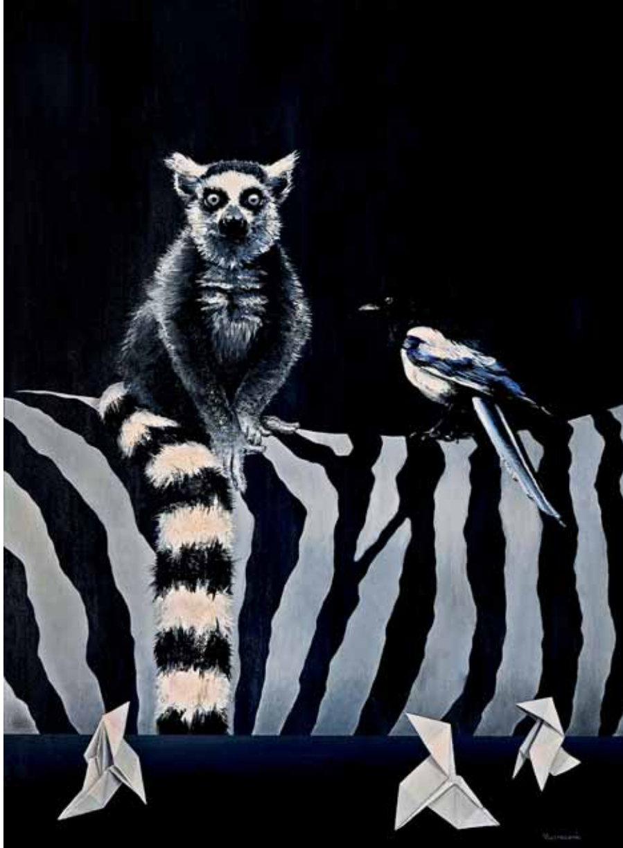
Et c'est en couleur! 73x54 cm