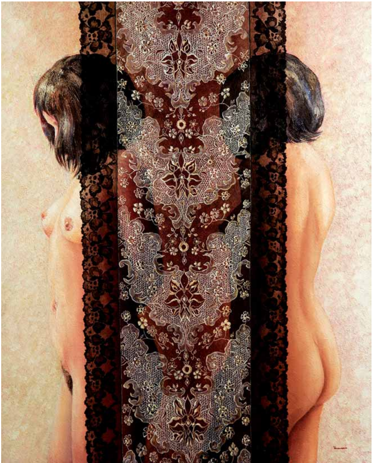
Pudeur Impudeur 100x81cm